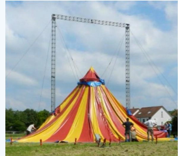
der große Augenblick!