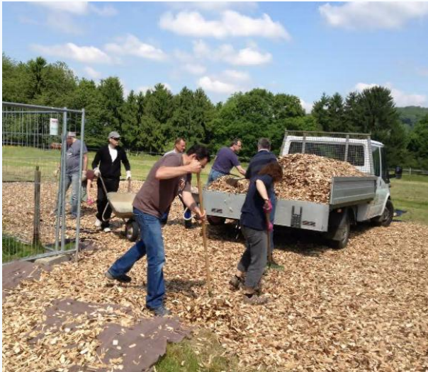
Vorbereitung des Untergrunds...