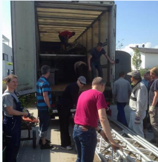
das Auspacken fängt an...